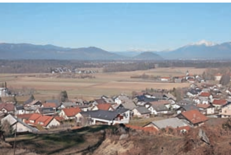
Del komasacijskega območja – pogled s poti, ki vodi na Stari grad nad Smlednikom

Komasacija bo predvidoma končana do sredine leta 2024, agromelioracijska dela pa leto kasneje.